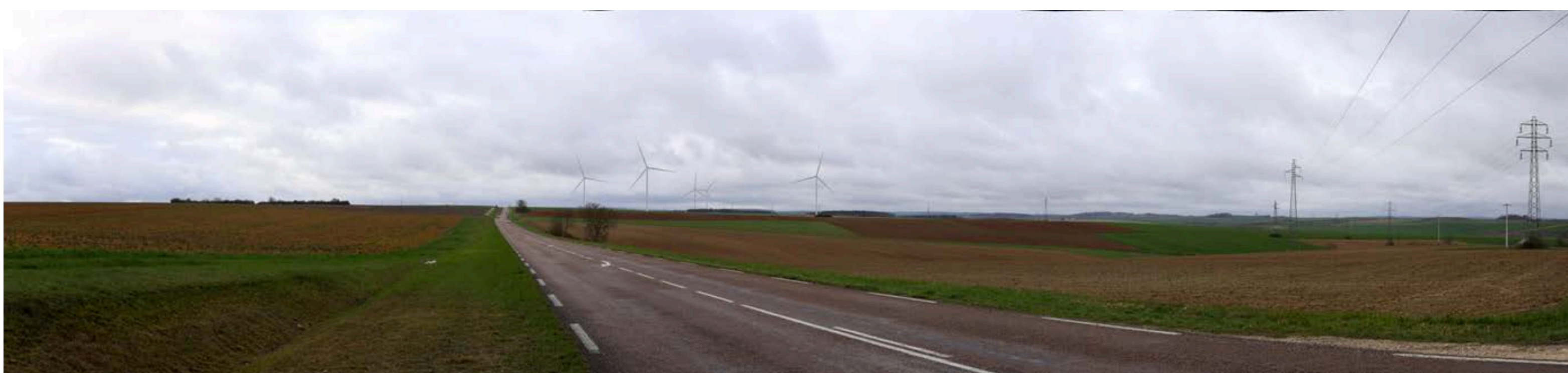
Point de vue : AUXERRE - sortie sud d'Auxerre par la D 239 (voie romaine)