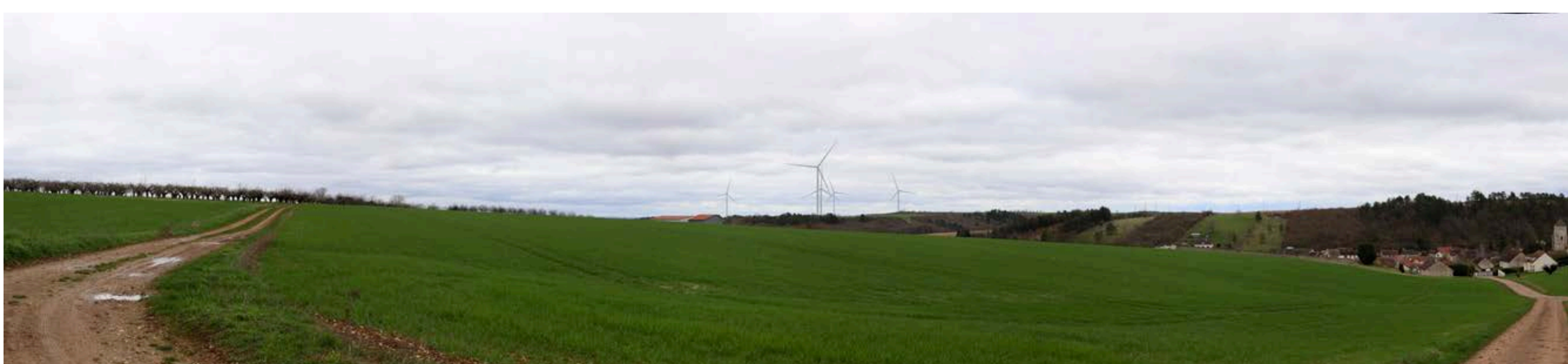
Point de vue : GY-L'ÉVÊQUE - entrée ouest de Gy-l'Évêque par une route locale